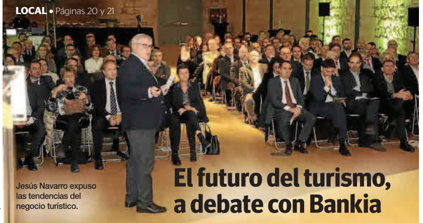
LOCAL • Páginas 20 y 21